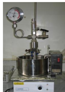
オートクレーブ 反応装置

Okayama, T.; Okayama, J.; Okayama, S Green Chem. 2020 , 25 , 1023.